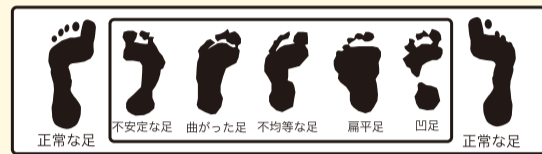
足型確認のイメージ ※写真はイメージです。

人間の体は、無意識のうちにまっすぐたうとする素晴らしい機能がっています。しかしそれが傾いたまま慢性化し長期間活動すると、膝、腰、肩、首などに痛みを伴います。痛みを伴うもの歪みを発見しやすいのが足型です。足型を計測して自分の痛みのもとや今後の体のことについて考えてみませんか?