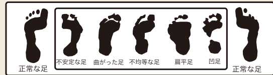
足型確認のイメージ ※写真はイメージです。

人間の体は、無意識のうちにまっすぐたどるとする素晴らしい機能が備わっています。しかしそれが傾いたまま慢性化し長期間活動すると、膝、腰、肩、首などに痛みを伴います。痛みのもとを歪みを発見しやすいのが足型です。足型を計測して自分の痛みのもとや今後の体のことについて考えてみませんか?